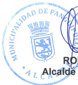
RODRIGO VALDIVIA ORIAS Alcalde Municipalidad de Panguipulli

Página Web de Municipalidad de Panguipulli; http://www.municipalidadpanguipulli.cl